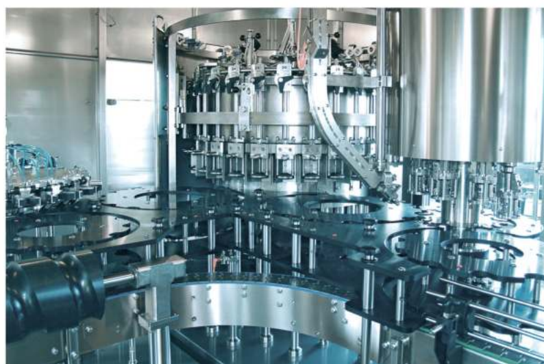
Clean Room of the multibloc/ Чистая камера мультиблока