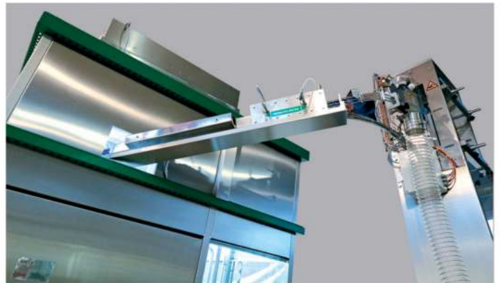
Orientator and sterilization of the caps/ Ориентатор и стерилизация крышек