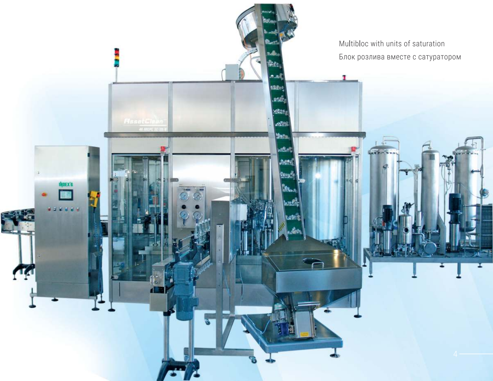
Multibloc with units of saturation

Укупорочная секция с линейным ориентатором для крышек с Pick and Place устройством и укупорочными головками с гистерезисным регулированием момента вращения, или с обкатывающими головками в зависимости от вида крышек – пластиковые винтовые или металлические нарезные.