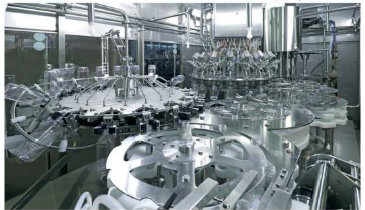
Clean Room of the multibloc/ Чистая камера мультиблока